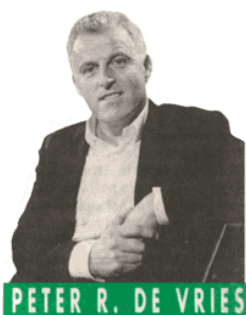
PETER R. DE VRIES